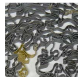
15. Galerie Collection